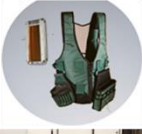
ชุดสำหรับใส่มาตึงงาน