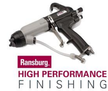
Ransburg. HIGH PERFORMANCE FINISHING