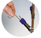
ตัวแขวนงานปิดจุดสัมผัส