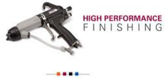
HIGH PERFORMANCE FINISHING