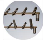
ตัวแขวนเป็นระดับ BHL