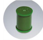
ปลั๊กอุดเนื้อเหล็ก