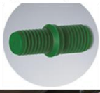
ปลั๊กอุดขนาดมาตรฐานเมตริก