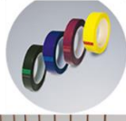
เทปมาตึงปิดผิวทนความร้อนสูง